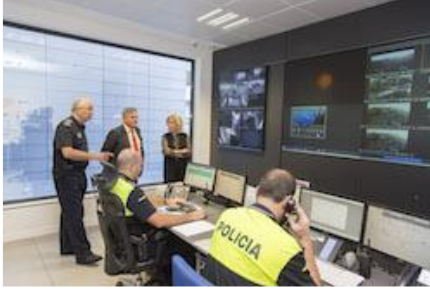
Visita Delegada Gobierno sept 2015

En la fotografía se observa que un sector de las cámaras inutilizado. Nunca llegó a repararse. Desde su instalación, la mayoría de las cámaras han ido paulatinamente estropeándose sin que nunca llegaran a ser reparadas. La pantalla principal quedó a oscuras a principios de 2016 y no volvió a funcionar año y medio después.