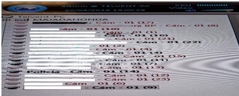
Imagen mayo de 2018

“La realidad actual es un sistema inoperativo que no sirve para ninguno de los fines para los que fue concebido”