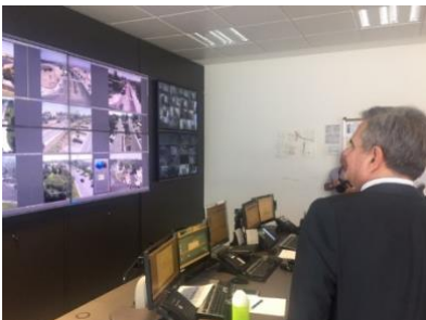
imagen Junio 2017. El ayuntamiento emitió nota de prensa informando de la mejora y actualización tecnológica.

El pasado mes de Junio de 2017, se sustituyeron las pantallas del centro de comunicaciones por cuatro televisores de última generación. El contrato ascendió a 9.637,65 euros, distribuido en 1375 euros x 4 pantallas de 55”, 1650 en materiales varios y 815 euros de mano de obra más impuestos.